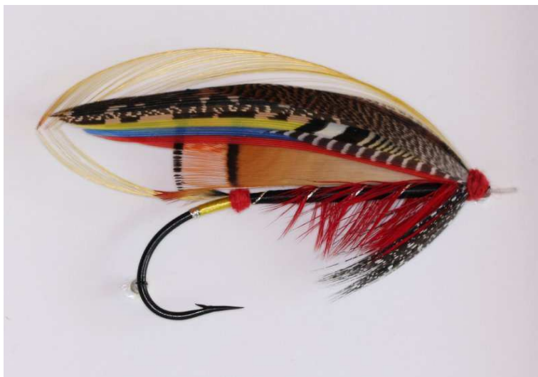
"Black Doctor" gebunden von Jörg Schuft / "Black Doctor" tied by Jörg Schuft

Beschreibung „Black Doctor“ nach T.E. Pryce-Tannat - Kategorie Lachsfliegen Description "Black Doctor" Pattern as per T.E. Pryce Tannatt - Pattern Categories: Classical Salmon Flies